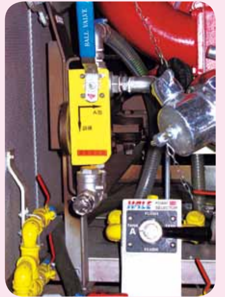
建議的外置吸泡口裝置 The proposed external foam intake system

本年度的消防處新構思獎勵計劃反應熱烈，這正好反映同事對改善工作效率的熱誠。評審委員會希望同事在來年能夠繼續踴躍參與，發揮可提升工作效率的創作潛能。