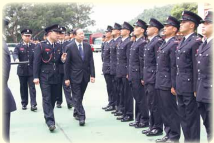
• 保安局局長黎棟國檢閱畢業學員 The Secretary for Security, Mr Lai Tung-kwok, reviews a passing-out parade at the Fire Services Training School

保安局局長黎棟國於 9 月 26 日主持消防處第 160 屆結業會操，本屆共有 13 名消防隊長、56 名消防員及 39 名救護員畢業。