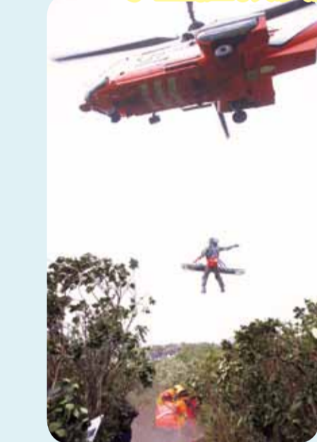
• 消防處於 10 月 12 日在香港大潭水塘郊野公園舉辦大型山火及攀山拯救演習，參與部門包括民眾安全服務隊、政府飛行服務隊、警務處、漁農自然護理署、醫院管理局、民政事務總署、社會福利署及醫療輔助隊。 An inter-departmental exercise on vegetation fire-cum-mountain rescue was held on October 12