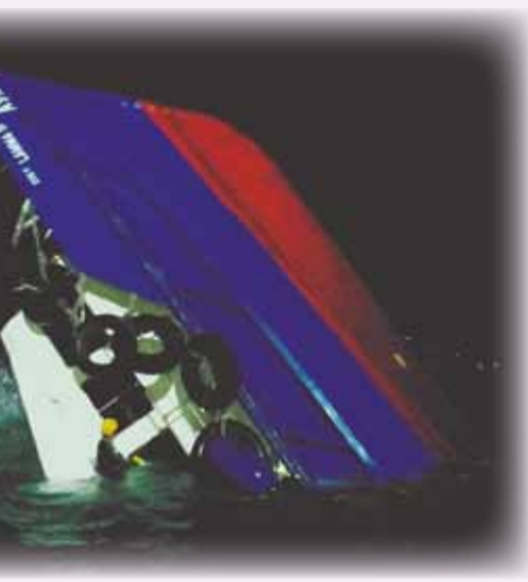
• 在南丫島撞船事故中肇事的「南丫IV號」 The half-sunken "Lamma IV" in the ferry tragedy