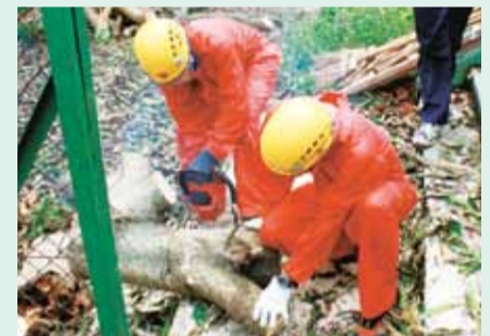
義工隊成員協助鋸除及清理倒塌大樹 Members of the F.S. Volunteer Team assist in cutting and clearing a fallen tree