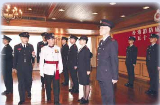
• 消防總長(九龍)岑永昌檢閱調派及通訊組畢業學員 CFO(K), Mr Shum Wing-cheong, reviews a passing-out parade of the Mobilising & Communications Group

九龍總區消防總長岑永昌於 9 月 7 日擔任調派及通訊組第 52 隊結業典禮的檢閱官並致訓辭，這批結業人員共有 8 名消防隊目(控制)，當日有超過 80 名嘉賓到場致賀，場面熱鬧。